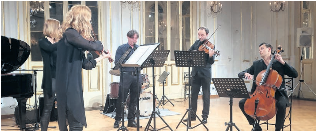
Profesorji Konservatorija za glasbo in balet Maribor so nastopili v različnih zasedbah.