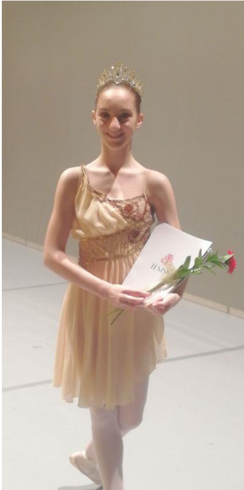
... v Lendavi z diplomo ...