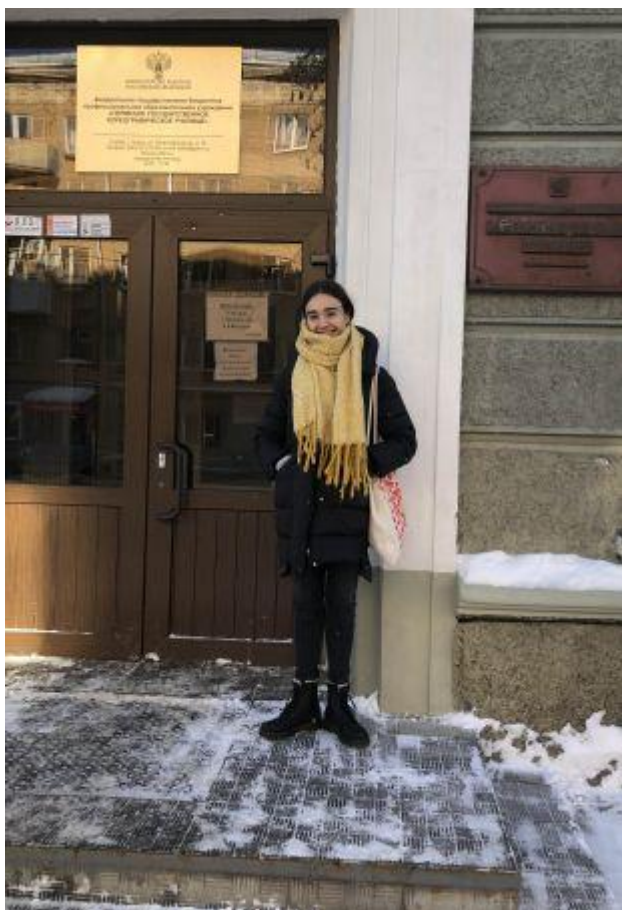
Pred šolo v mrzlem Permu in ...

Na tekmovanje si prišla naravnost iz Rusije, iz Perma, kjer obiskuješ drugi letnik (predzadnji) State choreographic collage. Kako si se pripravljala na tekmo in zakaj meniš, da so tekmovanja za vas mlade plesalce pomembna?