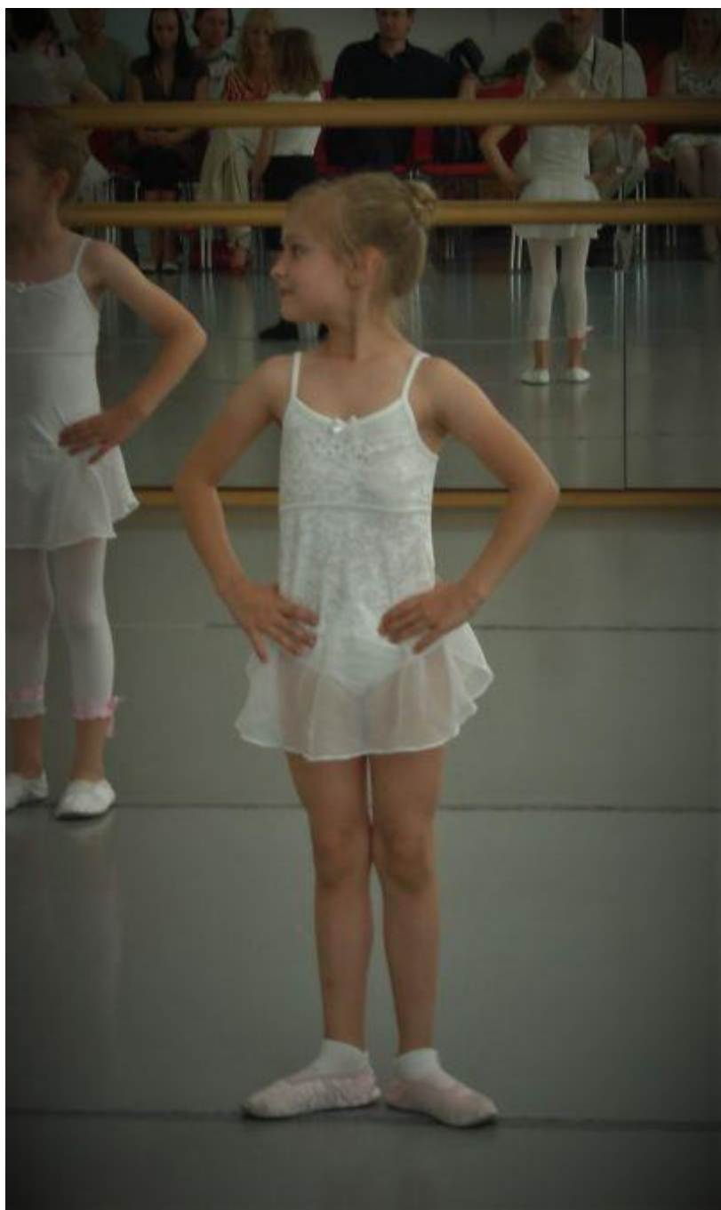
... baletni začetki ...

Sem 18-letna dijakinja in prihajam iz Maribora. Balet je znan kot moja največja strast, zato me večina pozna kot baletko. Kot oseba sem družabna, zelo zgovorna, rada odkrivam nove stvari in spoznavam nove ljudi, zelo imam rada živali, vse stvari delam ob glasbi in sem velika ljubiteljica pogovorov ob kavi. Največ mi pomenijo družina in moji prijatelji, ki me dan za dnem osrečujejo in vzpodbujajo.