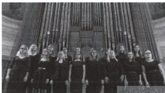
Dekliški zbor Akademije za glasbo Univerze v Ljubljani.