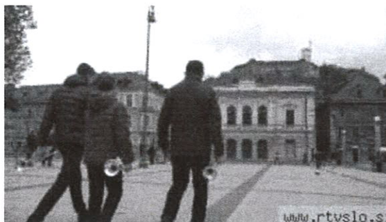
Za glasbo živimo je glasbeno-dokumentarna oddaja, v kateri sledimo razvoju javnega glasbenega šolstva v Sloveniji. Premierno jo bomo predvajali v sredo, 9. novembra, ob 20.45 na TV SLO 2.