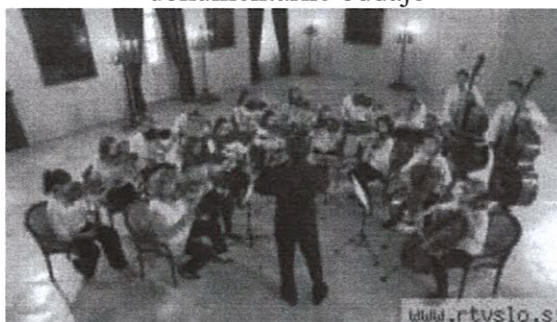
Godalni orkester Konservatorija za glasbo in balet Maribor.